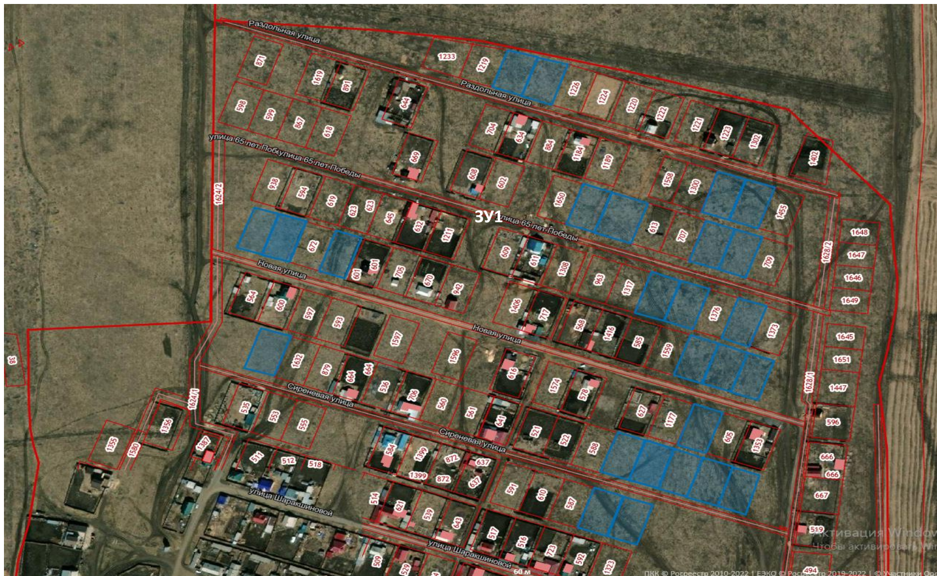
Схема расположения земельных участков в Боханском районе, п. Бохан, ул. Сиреневая, ул. Новая, ул. 65 лет Победы, ул. Раздольная